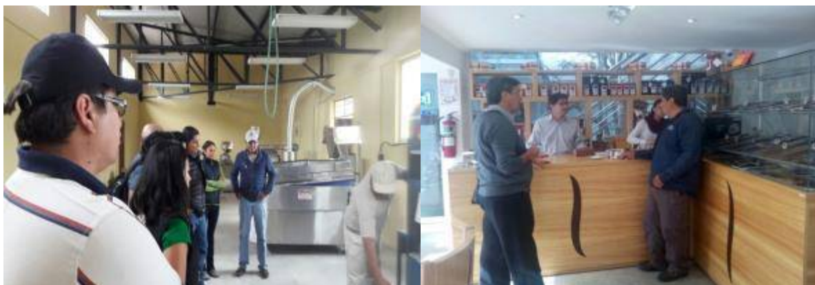
Foto 1. Foto2. Articulación Pública para acreditación de laboratorio (ARCSA), innovación tecnológicay redes de comercialización con Fundación C&D

El Gobierno Autónomo Descentralizado de la Provincia de Pichincha con base en su competencia de fomento productivo mediante un proceso permanente de participación, diálogo, concertación, articulación público, privada y académico que contribuye al fortalecimiento organizacional, mejoramiento tecnológico, promoción comercial y búsqueda de nichos de mercado para beneficio de aproximadamente 100 familias de productores de café en Noroccidente de Pichincha. Entre sus diferentes acciones figura la construcción de una primera microfábrica de café, la apertura hacia servicios de capacitación agrícola bajo las denominadas “Escuelas de Campo”, mejoramiento poscosecha, participación en eventos de promoción y articulación comercial y la dotación de insumos y suministros para uso del pequeño y mediano productor de Pichincha.