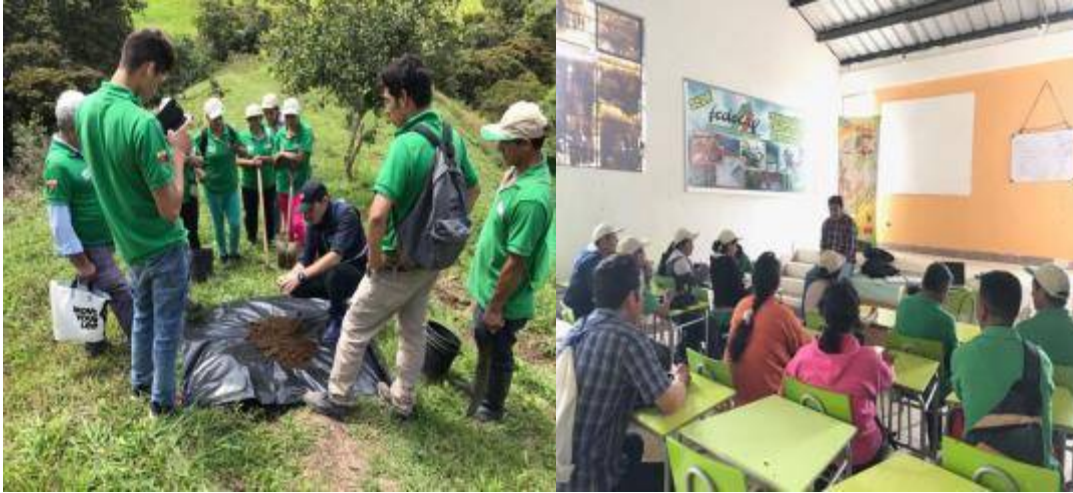
Foto 3. Práctica de Campo Modulo Agrotecnia , Cursos análisis de Suelos Agrocalidad-GADPP

La Dirección de Gestión de Apoyo a la Producción gestiona procesos de capacitación y asistencia técnica para el mejoramiento e innovación de las prácticas agrícolas y agroindustriales con la generación de valor agregado para beneficio de aproximadamente 120 familias de productores de Caña de Azúcar Otros Usos en Noroccidente de Pichincha, en las parroquias de Pacto, Guallea, Nanegal y Nanegalito. De la misma forma mediante coordinación interinstitucional se apoya las actividades de promoción y articulación comercial.