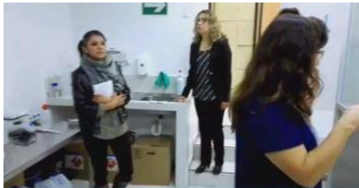
Representantes del laboratorio de alimentos de ARCSA.

La visita se realizó en el marco del convenio suscrito entre el GADPP y ARCSA para fortalecer y sumar capacidades, incentivando el desarrollo y fortalecimiento de programas, proyectos y actividades que benefician a los diferentes sectores productivos de la provincia.